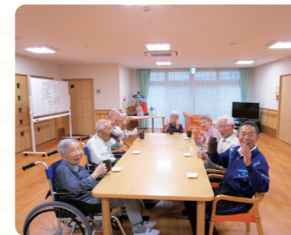
リビングでおやつ作りをして、皆で美味しく食べている、コーヒータイムの一時です。