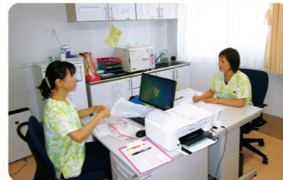
看護スタッフにより、常にご入居者様のお身体の変化に対応いたします。