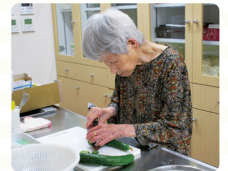
苑内で栽培した野菜を食事に出すために、ご入居者様が料理をされている様子です。