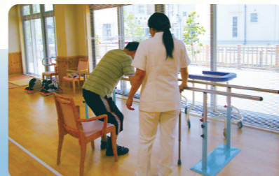
理学療法士(PT)によって機能向上もサポートしています。