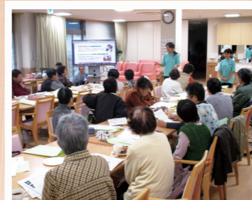
介護なんでも相談会