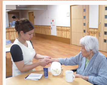
ハンドマッサージ