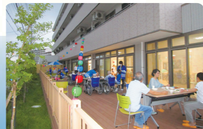
1階のデイサービス施設内のウッドデッキでの納涼夏祭り(ピアガーデン)の風景です。ご家族、職員とともに楽しんでいただいております。