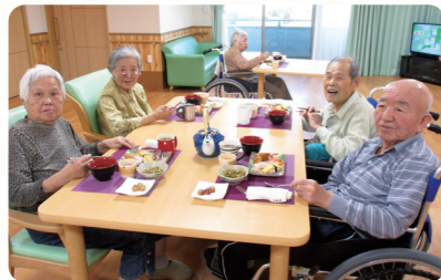
皆様が美味しく楽しくお食事をしていただいております。満腹御膳、ご馳走御膳等、食事を楽しめる暮らしがあります。