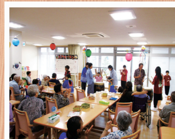
納涼夏祭り(ピアガーデン)