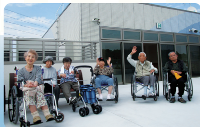
屋上庭園で、きれいな花々を見たり、風や太陽の光を感じたりしながら、季節を感じて頂き、心身とともにリフレッシュしていただけます。