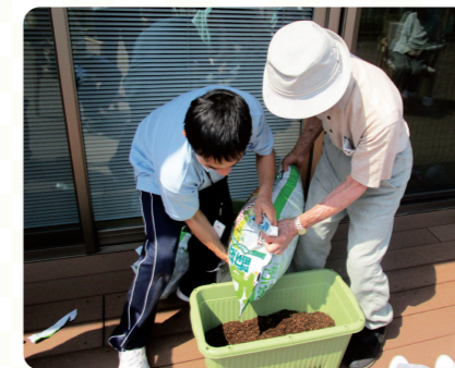
苑内のウッドデッキで、菜園作りをしている様子です。