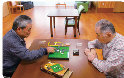
リビングで利用者同士雑談したり、趣味に取り組むなどして、思い思いに時間を過ごしている様子です。